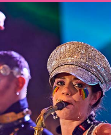
Conciertos y espectáculos