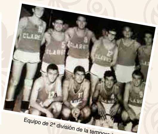
Equipo de 2ª división de la temporada 73-74