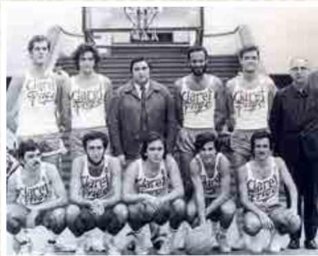
Final de la temporada 64-65 con la afición en las escaleras