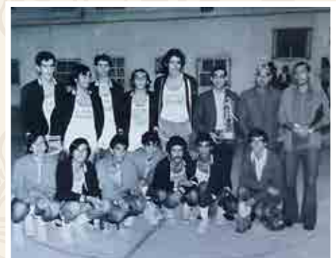
Segundo Torneo Padre Dominguez