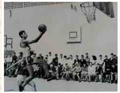
Equipo campeón de Tercera división, temporada 68-69