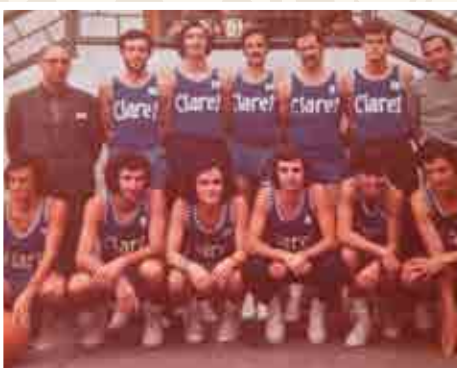
Equipo de 2ª división de la temporada 74-75