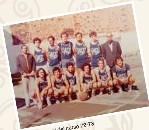
Equipo Juvenil del curso 72-73