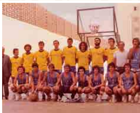
Equipo de 2ª división en la campaña 76-77