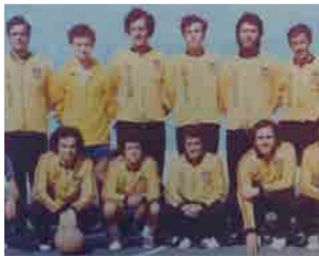
Equipo 2ª división de la temporada 72-73