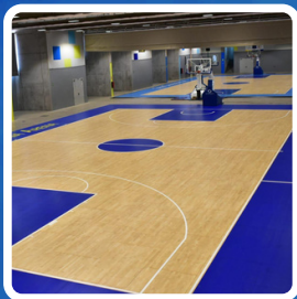
SALA CLUB GRAN CANARIA ARENA