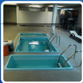
PISCINAS DE CONTRASTE