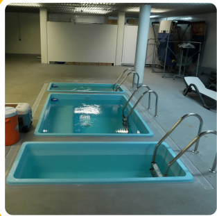
PISCINAS DE HIDROTERAPIA DE CONTRASTE