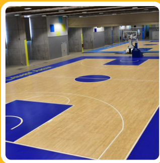
SALA CLUB GRAN CANARIA ARENA